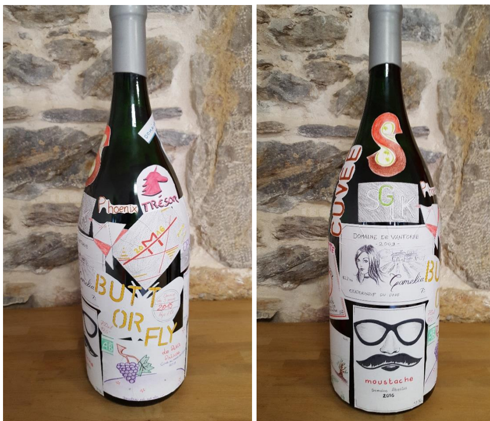
Exemple de réalisation.

Faites créer un impressionnant Jéroboam ou Mathusalem (taille de la bouteille en fonction du nombre d'équipes) en souvenir de ce moment convivial. Les étiquettes réalisées par vos participants y seront apposées de manière artistique. Ce patchwork décalé interpellera à coup sûr dans vos couloirs. Vous le récupérez directement sur votre événement !